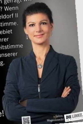
Sahra Wagenknecht DIE LINKE.